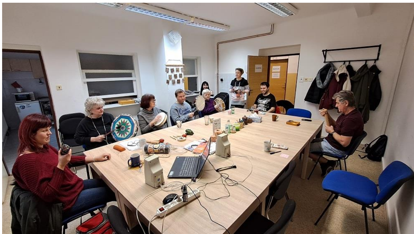
Společná fotografie při hraní na hudební nástroje