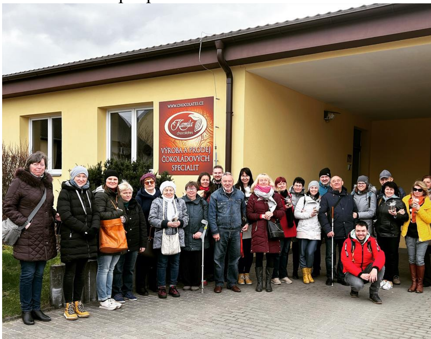
Skupinová fotografie před čokoládovnou Kamila Chocolates, s.r.o.