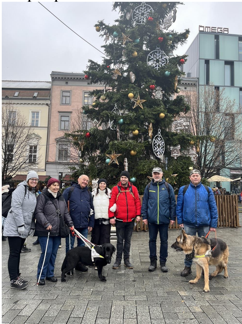
Společná fotografie z vánočních trhů v Brně u vánočního stromu