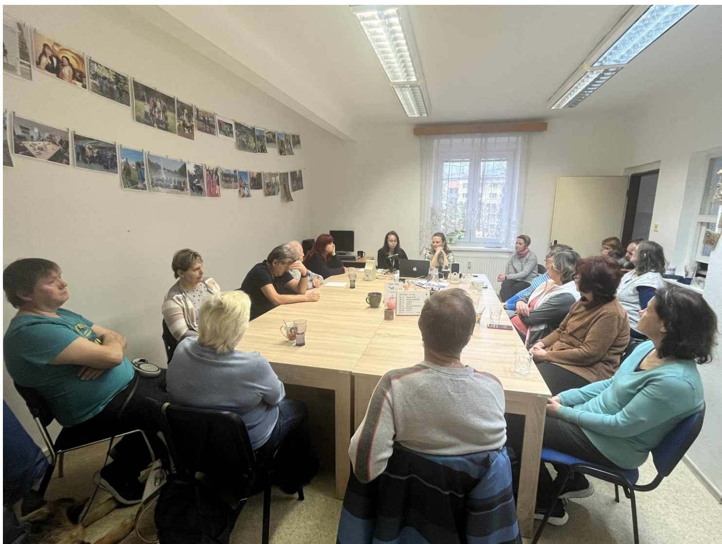
Společná fotografie z informační schůzky