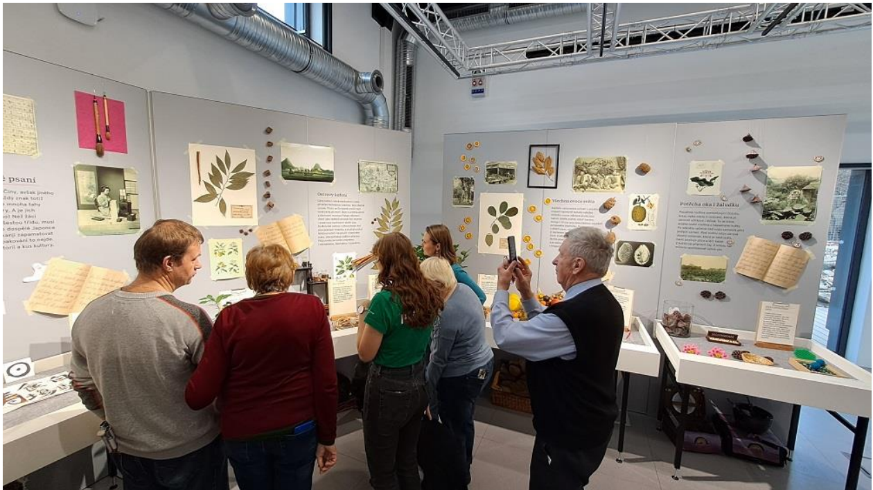
Fotografie některých našich účastníků výstavy s p. průvodkyní