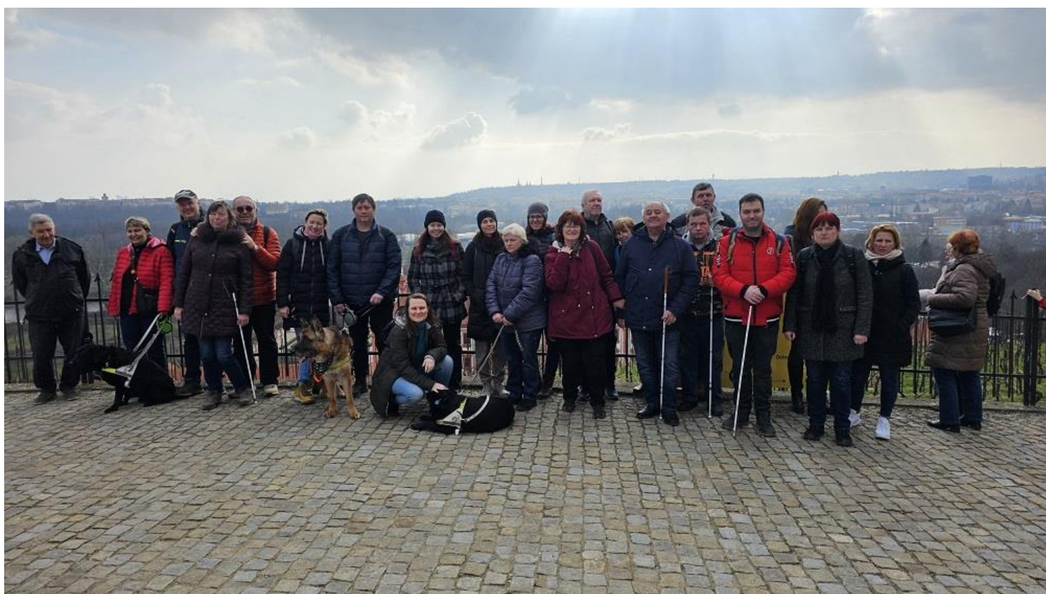
Společná fotografie z Botanické zahrady Praha