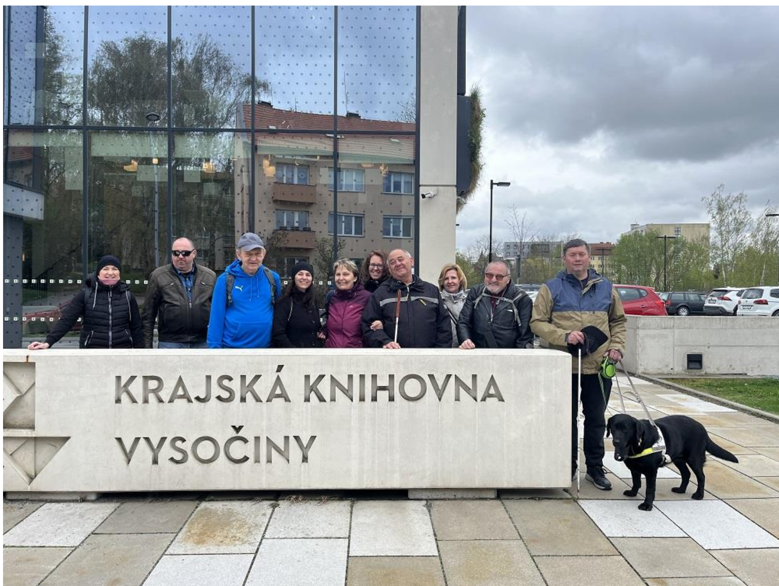
Společná fotografie před Krajskou knihovnou Vysočiny v Havlíčkově Brodě