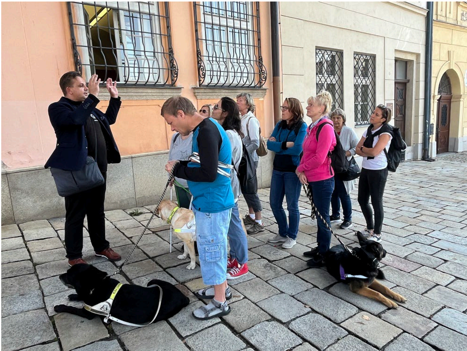
Společná fotografie z procházky Pivovarskou stezkou v Jihlavě