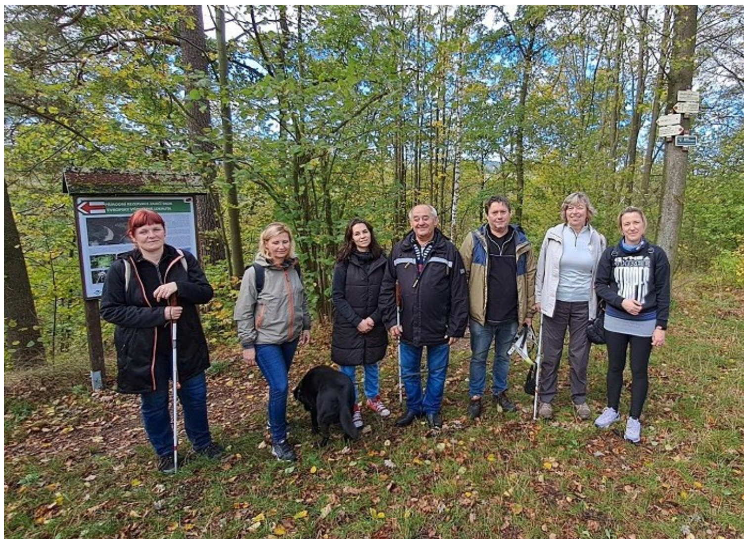
Společná fotografie z procházky na Zaječí skok