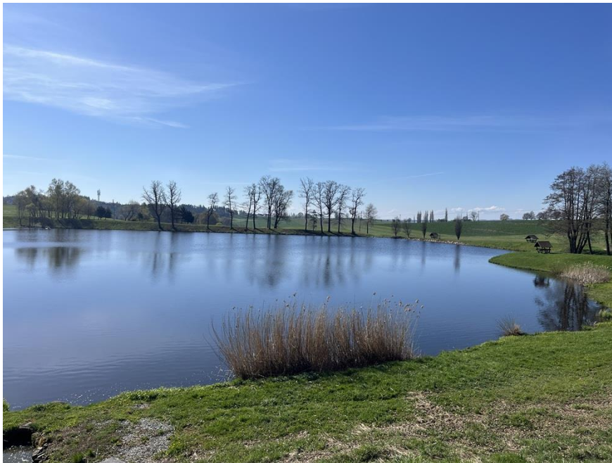
Foto rybníku ve Stříbrném Dvoře