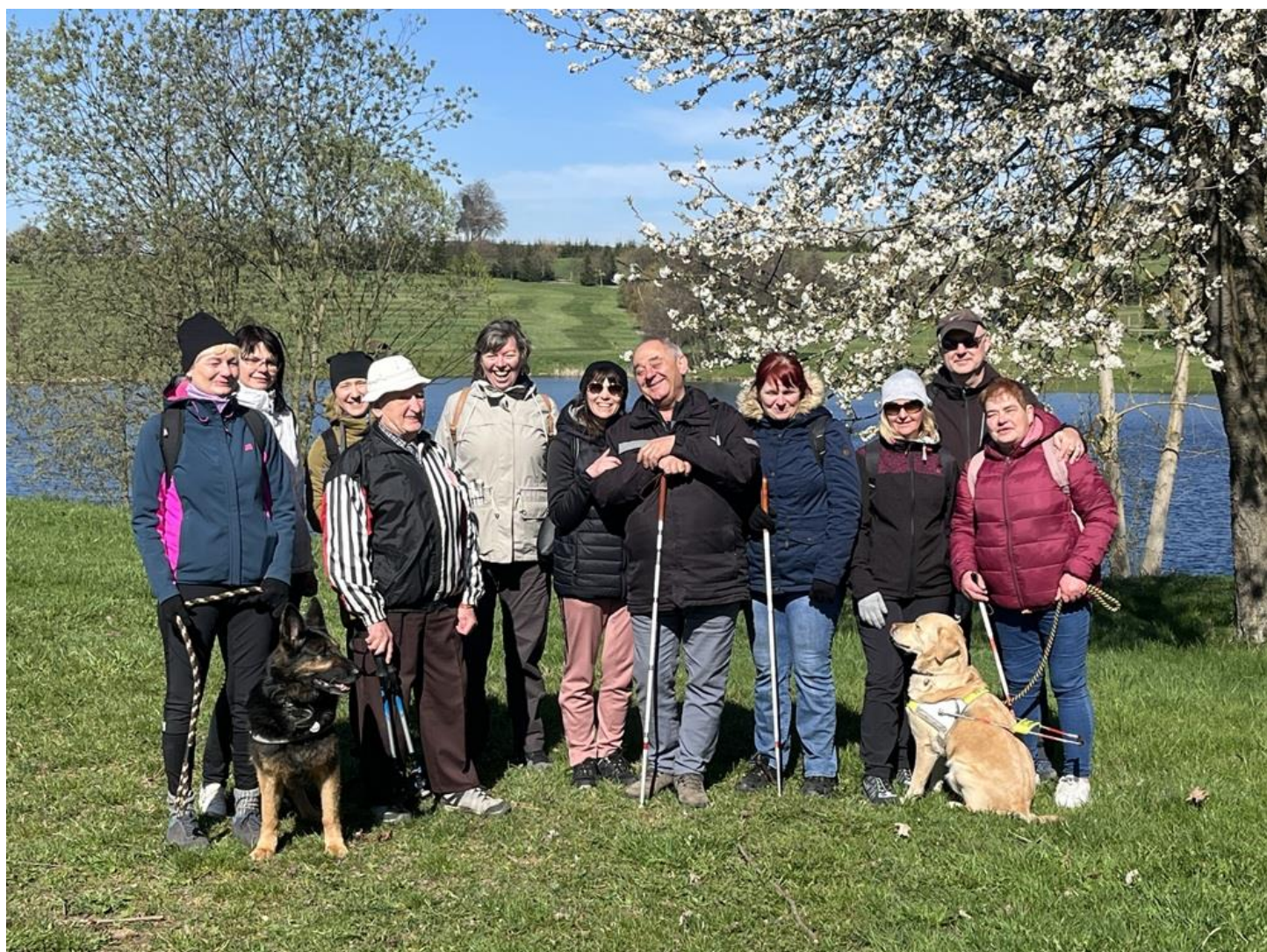
Společná fotografie z procházky na Stříbrný Dvůr