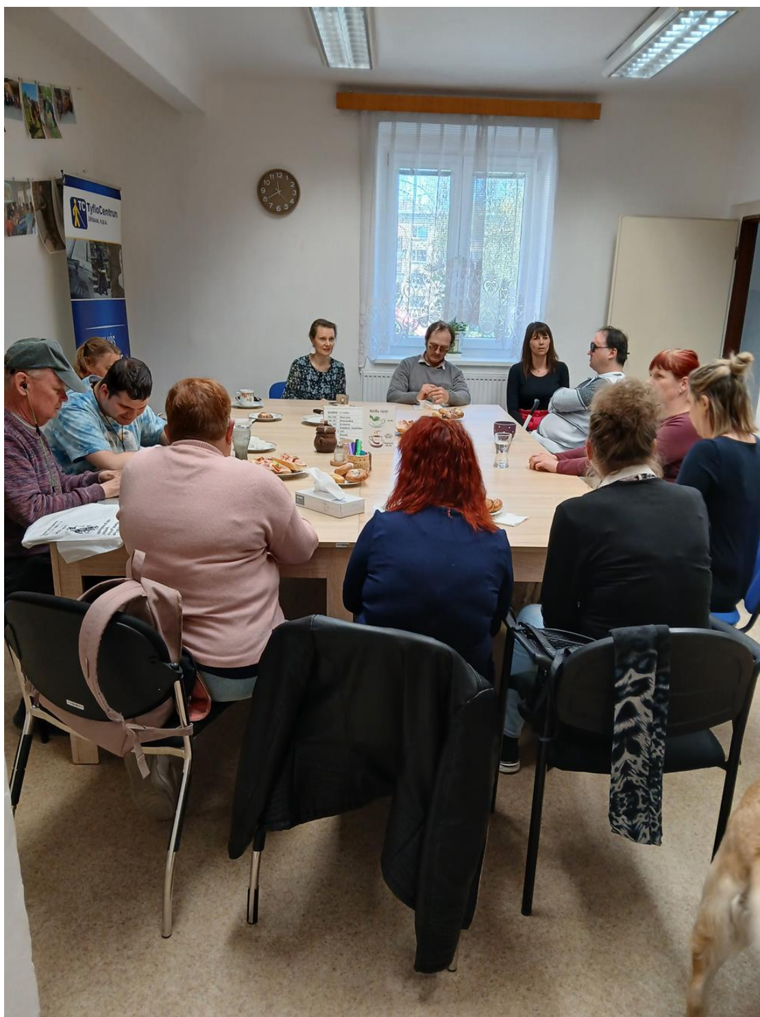
Společná fotografie účastníků soutěže, pracovníků TyfloCentra a SONS Jihlava